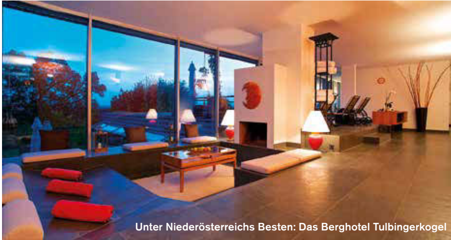
Unter Niederösterreichs Besten: Das Berghotel Tulbingerkogel