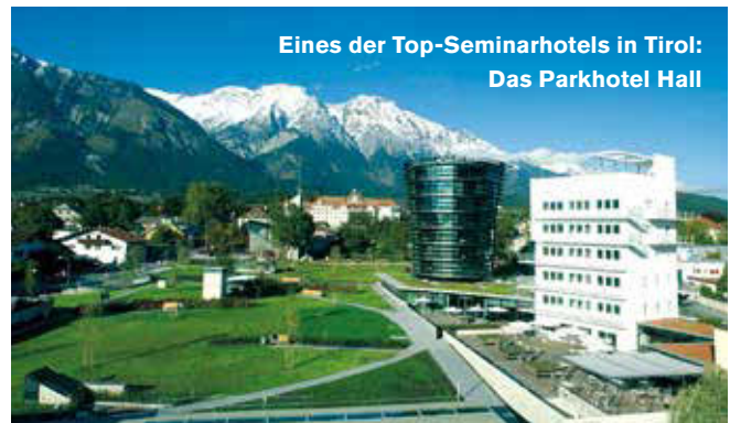
Eines der Top-Seminarhotels in Tirol: Das Parkhotel Hall