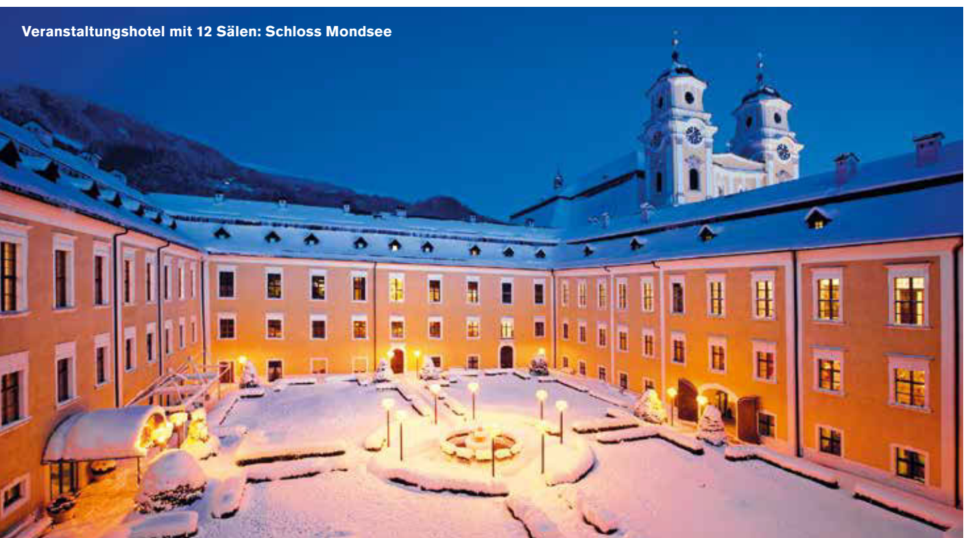
Veranstaltungshotel mit 12 Sälen: Schloss Mondsee

C. HOTELRAINERS, ARCHIV, C. BLAUDEL, SCHLOSS MONDSEE