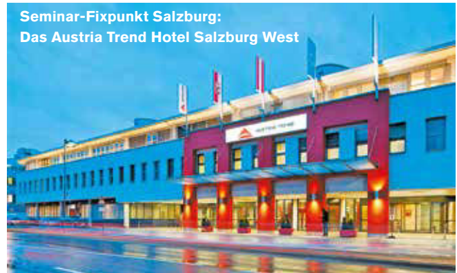
Seminar-Fixpunkt Salzburg: Das Austria Trend Hotel Salzburg West