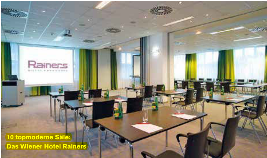
10 topmoderne Säle: Das Wiener Hotel Rainers