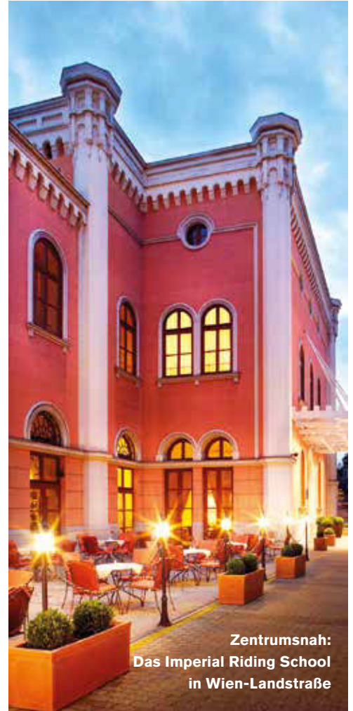
Zentrumsnah: Das Imperial Riding School in Wien-Landstraße